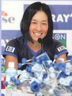
会場でクルム伊達公子選手が記者会見した様子。KAORUKOオリジナルのワイヤリングテクニックが光るブルーのテーブルアレンジ。