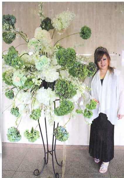
美智子皇后陛下をイメージした作品。グリーンやさわやかなイメージでラインを生かしたアレンジに。中央にはブリザのメリアをいれ、皇后陛下のお帽子をイメージ。