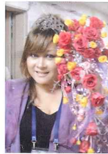
優勝直後のシャラポワ選手とKAORUKOさん。ユニフォームにあわせてデザインされ、オリジナルビーズをあわせたピンクと黄色ブリザのゆれるブーケ。