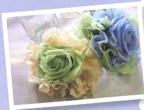
ブリザードフラワー協賛 / フロールエバー