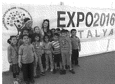
2016年花博のイベントで子供たちと交流

「カワイイ」の表現、ゆるれるアーケを次々と披露。24日のメインのショーは、街の中心地・共和国広場に来場者1500人以上が詰めかけ、氏のエンターテインメントを五感で楽しんだ。