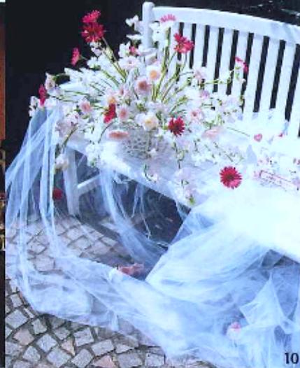
10 ウェルカム・フラワーには花嫁の大好きなピンクのガーベラをリクエスト。美しく語らうようなアレンジに。 11 美しい涼感を放つKAORUKOブランドオリジナルのシャンデリアスタイルのアレンジが会場を彩ります。