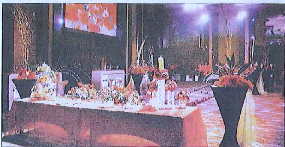
具有日式风格的婚庆现场